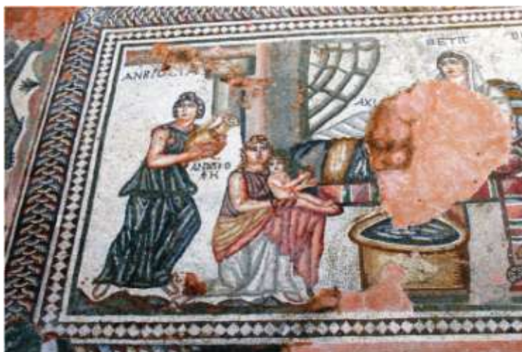
Fig. 6. Nașterea lui Dionysos (Nea Paphos, Cipru SV, Casa lui Aion, detaliu mozaic) / Birth of Dionysus (Nea Paphos, Cyprus SW, House of Aion, mosaic detail) (Welch 1998, 360, fig.138; http://romeartlover.tripod.com/Paphos2.html ).

Remarcăm încă odată numărul extrem de mic al descoperirilor arheologice de pe teritoriul Dobrogei care ilustrează copilăria acestei divinități extrem de complexe, în contrast cu marea răspândire a cultului său. Personal, cunosc doar trei: două figurine elenistice din lut ars, terracotta de tip Tanagra , din sec. III-II a.Chr., aflate în Muzeul de Istorie Națională și Arheologie din Constanța 40 (Fig. 12/1-2); un vas de bronz ( oenochoe ) cu reprezentări bacchice figurate, descoperit la Callatis, într-un mormânt de incinerare în tumul, din sec. II p.Chr. 41 (Fig. 12/3). Am introdus în această grupă și originalul altar bacchic din calcar, de epocă romană, descoperit la Urluia, în teritoriul tropaeian 42 , deoarece, dincolo de stângăciunile de execuție, sculptorul a izbutit să realizeze proporțiile normale ale personajului sculptat, un băiețandru, aflat între vârsta copilăriei și aceea a adolescenței.