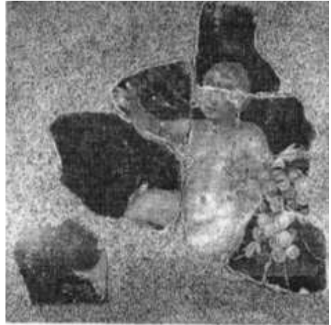
Fig. 10. Pictură murală din villa rustica de la Baláca (Pannonia), detaliu cu Dionysos copil / Mural in rustic villa Baláca (Pannonia), detail with child Dionysos (Kirchhof 2002).

Anumite apropieri stilistice cu piesa de la Tulcea întâlnim în Dobrogea sec. al II-lea p.Chr., pe placa votivă de la Mangalia, pe care am amintit-o mai sus, și pe altarul bacchic de la Urluia, în special, în privința coafurii personajului divin, cu precizarea că, în cel de-al doilea caz, de șuvițele de păr care cad pe umeri zeului sunt atârnați doi ciorchini de struguri. Micul și originalul altar bacchic din calcar de la Urluia ne atrage atenția prin atitudinea relaxată a personajului adolescentin, diferită de aceea a lui Dionysos din reliefurile votive de la Tulcea, dar realizată în aceeași manieră stilistică. Realizarea unor opere artistice în aceeași manieră stilistică originală evidențiază fenomenul constituirii unei arte sculpturale specifice provinciei romane de la Dunărea de Jos.