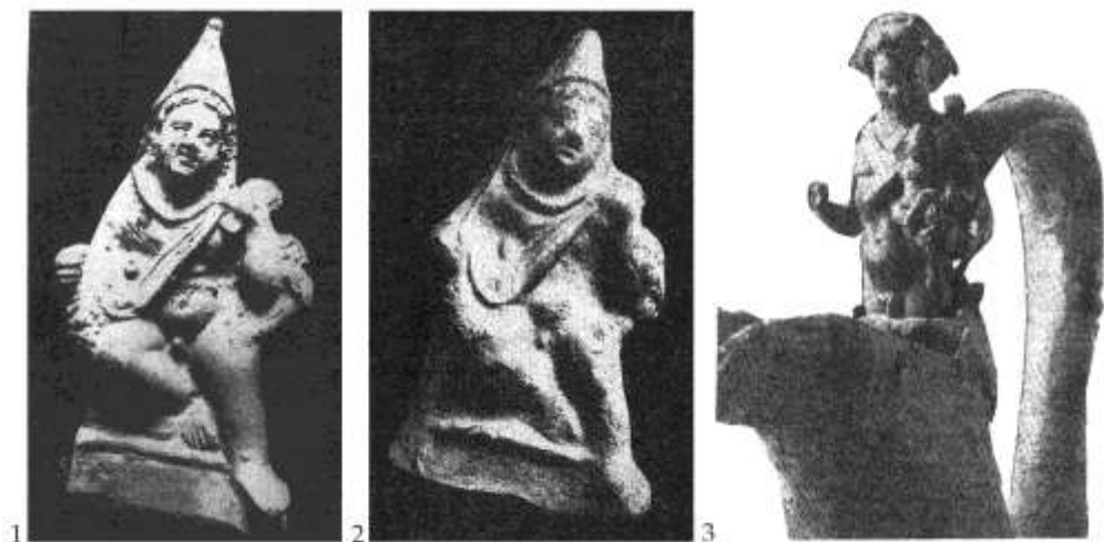
Fig. 11. 1. Bacchus-copil. Figurină din lut ars din Tomis (?), MINA-Constanța; 2. Teracotă, colecția Canarache, MINA-Constanța; 3. Satyr în brațe cu Bacchus-copil, vas de bronz, sec. II p.Chr., Callatis / Child Bacchus. Burnt clay figurine from Tomis (?), MINA-Constanța; 2. Terracotta, Canarache collection, MINA-Constanța; 3. Satyr holding child Bacchus, bronze vessel, 2 nd c. AD, Callatis (Irimia 1966; Scorpan 1967).

scena Cavalerului-Erou , descoperirea reliefului dionysiac de pe dealul Mahmudiei nu numai că atestă o nouă villa rustica , dar constituie încă o dovadă arheologică despre intensitatea cultului dionysiac din zona Gurilor Dunării, în primele secole după Hristos. Acest fenomen, care reflectă psihologia proprie populației din acest ținut, respectiv credința în nemurire și veșnica nevoie de mântuire și de ocrotire a vieții oamenilor și a căminelor lor, se manifestă în grefarea unor noi concepții religioase pe fondul intim, afectiv al autohtonilor.