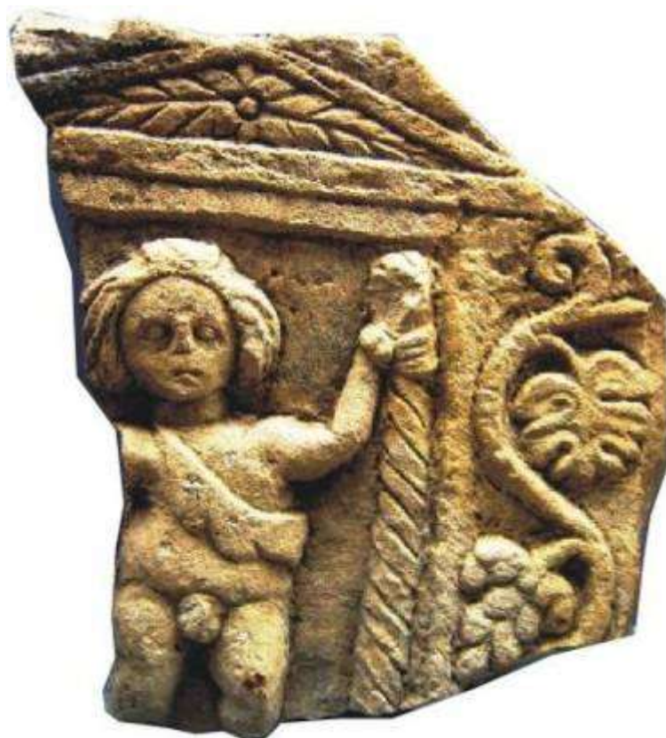
Fig. 2. Dionysos copil, Tulcea–Dealul Mahmudiei / Child Dionysos, Tulcea–Dealul Mahmudiei.

Spațiul adâncit al intrării este dominat de prezența statuară a copilului Dionysos. Trupul infantil al acestuia, aproape complet nud, este acoperit cu tradiționala blăniță de ied ( nebris ), prinsă în diagonală de umărul drept. O frunzuliță de viță-de vie îi acoperă organul genital. Cu mâna stângă ridicată ține toiagul divin = thyrs -ul, masiv și complet înfășurat cu o taenia vegetală, groasă, lungă și lată. Sub conul de pin din capul toiagului, palma exagerat de mare a copilului, în comparație cu antebrațul firav al acestuia, accentuează atitudinea personajului, prezentat în mișcare, cu piciorul stâng adus înainte. Figura rotundă a copilului este înconjurată de păr bogat, prins într-un coc în creștetul capului și dispus în șuvițe groase care îi cad pe umeri, asemănător coafurii dionisiace de pe o plăcuță votivă din Mangalia, din sec. al II-lea p.Chr. 4 .