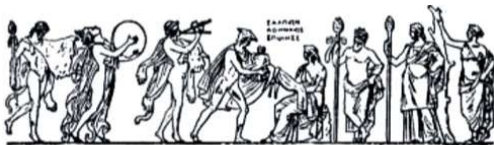
Fig. 3. Nașterea lui Dionysos (Muzeul din Napoli, Italia) / Birth of Dionysus (Museum of Naples), Italy ( http://www.truthbeknown.com/dionysus.html ).