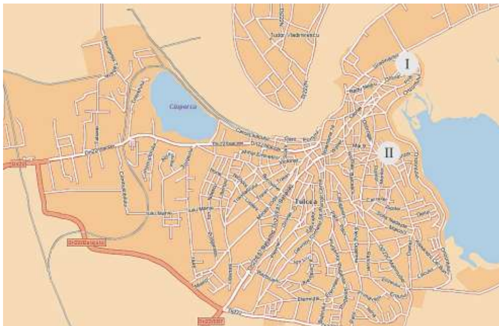
Fig. 1. Planul orașului Tulcea cu locul descoperirii reliefului dionisiac (II), la cca. 1 km SE de cetatea Aegyssus (I) / Layout of Tulcea with the place of discovery of the Dionysian bas-relief (II), approx. 1 km SE of Aegyssus settlement (I).

Fragmentul de relief votiv a păstrat o mare parte din imaginea copilului Dionysos , sculptată în nișă, în basorelief, încadrată de chenare late și fronton triunghiular 2 , sugerând fațada unui templu, sau mai degrabă a unui monument funerar.