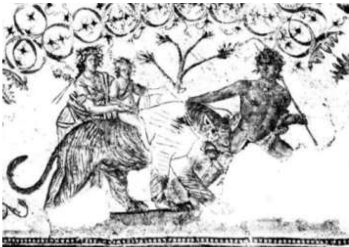
Fig. 7. Dionysos copil, călare pe panteră, cu nimfă și satir, detaliu din mozaicul din Djemila (Algeria) / Child Dionysus riding a panther, with nymph and satyr, detail in the mosaic of Djemila (Algeria) (Blanchard 1980, 170, fig. 1).

Nysa. Vârsta personajului sculptat pe monumentul de la Tulcea este comparabilă cu aceea a copilului Dionysos călare pe panteră de pe mozaicul din Djemila (Fig. 7) și/sau cu aceea a lui Dionysos cu ciorchinele de strugure, aflat în spinarea satyrului, în Villa Albani din Roma (Fig. 11/2).