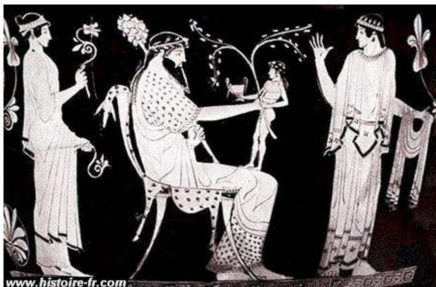
Fig. 5. Dionysos renăscut, pictură roșie pe fond negru, ceramică attică, sec. al V-lea a.Chr. (Muzeul Luvru) / Dionysus reborn, red on black painting, Attic ceramic, 5 th c. BC (Louvre Museum) (www.histoire-fr.com: Les Dieux grecs – files. Mythologie grecque. I. La Genèse, II, Les Olympiens, no. 13 ).

frumoasele și interesantele reliefuri votive de la Făgărașu Nou (jud. Tulcea), din sec. II-III p.Chr. 35 Reliefurile votive mici și mijlocii și aediculae -le, în care figura centrală a compoziției este cea a divinității, sunt cele mai răspândite monumente dionysiace de pe teritoriul Dobrogei 36 . Aceștia li se adaugă teracotele 37 , hermele și efigiile cu caracter decorativ-simbolic 38 . Măștile greco-romane, reduse ca număr, aparțin în totalitate tradiției bacchice, fiind reprezentări ale lui Dionysos- Bacchus , tânăr și matur 39 , dar niciodată copil.