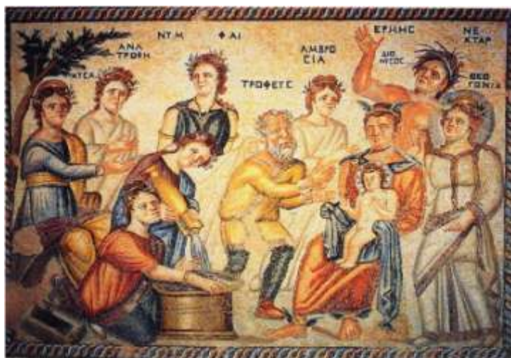
Fig. 8. Îmbăierea copilului Dionysos (Nea Paphos, Cipru SV, Casa lui Aion, detaliu mozaic) / Bathing of child Dionysus (Nea Paphos, Cyprus SW, House of Aion, mosaic detail) (Welch 1998, 360, fig. 138; http://romeartlover.tripod.com/Paphos2.html ).