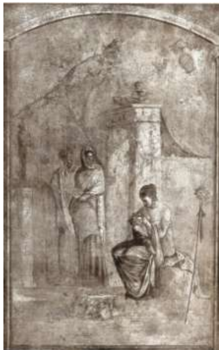
Fig. 9. Frescă din Villa Farnestina, pruncul Dionysos alăptat de doică / Fresco in Villa Farnestina, Infant Dionysus, breastfed (Alpatov 1962; Bragantini 1982).

Atitudinea personajului și maniera artistică diferă, deoarece sculptorul din Aegyssus urmărea altceva. De aceea, considerăm că relieful votiv de la Tulcea contribuie, mai ales, la o mai bună înțelegere a felului în care zeul continua să fie văzut în plină epocă romană, aici, la marginile de nord-est ale Imperiului, într-o epocă în care vechilor credințe ale geților, legate de cultul străbunilor, al sufletelor nemuritoare, li s-a adăugat în epoca romană conceptul religios al mântuirii 43 .