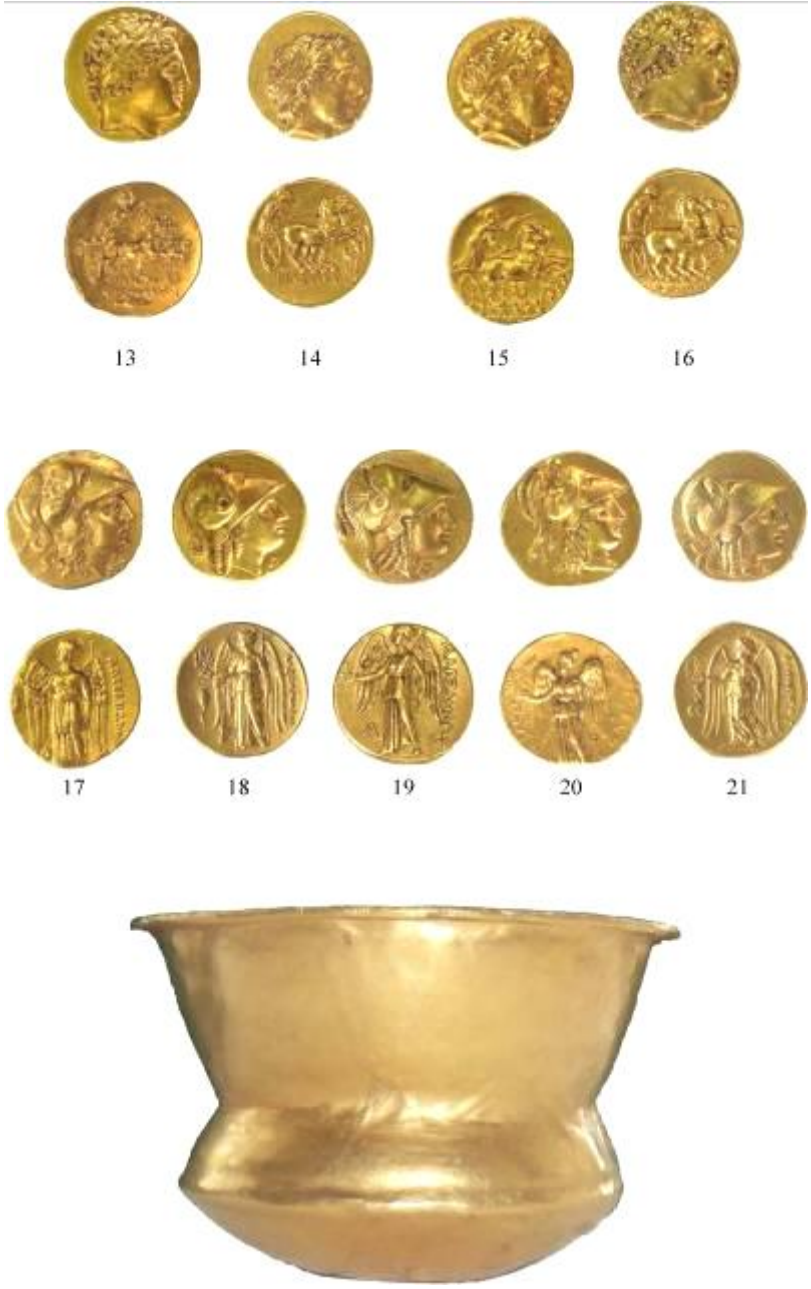
Pl. II. Monnaies et le vase du trésor de Lărguța (IGCH 800).