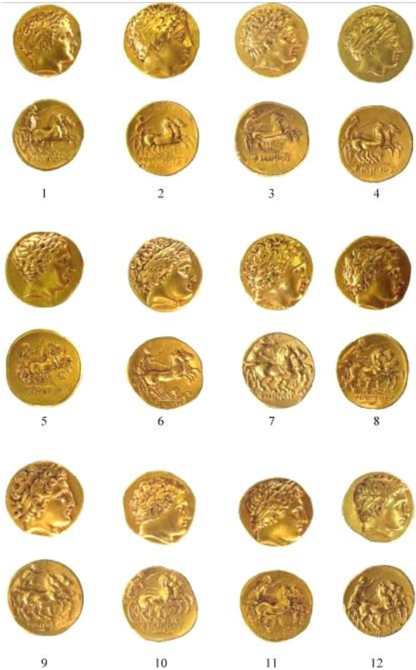
Pl. I. Monnaies du trésor de Lărguța (IGCH 800).