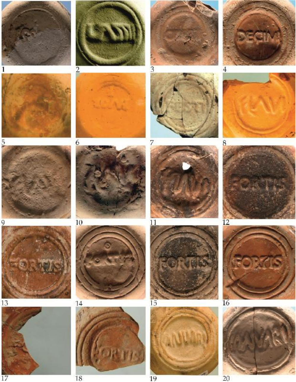
Fig. 3. Ștampile de pe opaițe Firmalampen descoperite la Durostorum –Ostrov (Ferma 4) / Marks on Firmalampen found at Durostorum –Ostrov (Ferma 4).