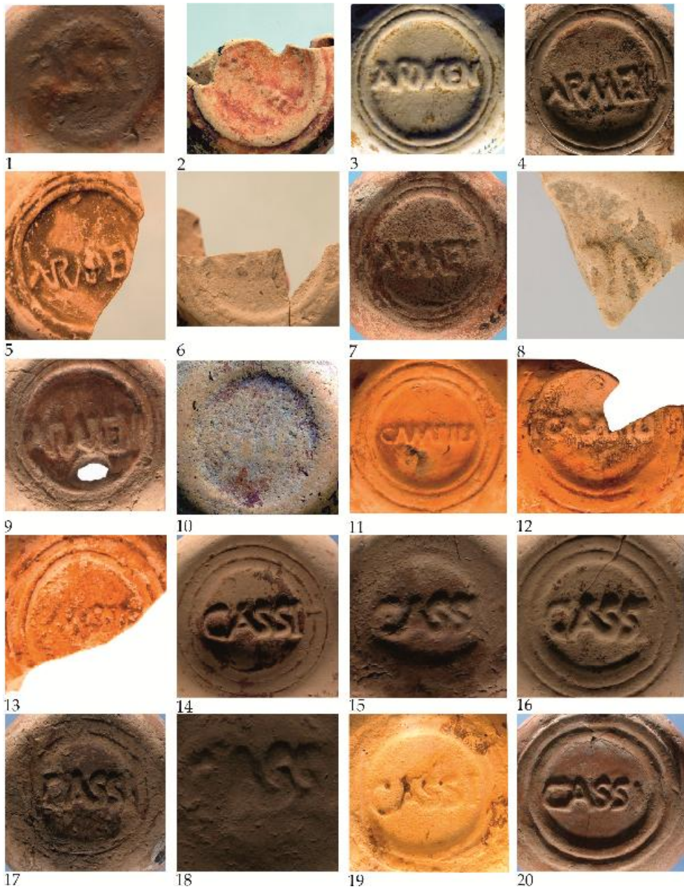
Fig. 2. Ștampile de pe opaițe Firmalampen descoperite la Durostorum-Ostrov (Ferma 4) / Marks on Firmalampen found at Durostorum-Ostrov (Ferma 4).