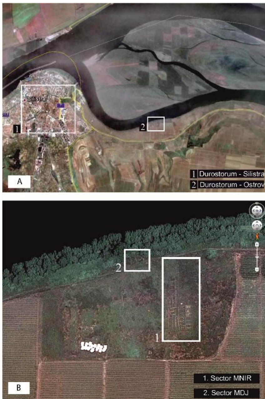
Fig. 1. Situl arheologic Durostorum / The archaeological site of Durostorum.