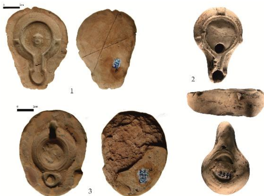
Fig. 5. Tipare de opaițe (1, 3) și rebut (2) descoperite la Durostorum / Lamp moulds (1, 3) and scrap (2) found at Durostorum.

morfologice, apar semne clare de lucrător, în general mici creștături, unele repetate, situate pe lateralele opaițului). Este logic ca un produs mai slab calitativ, atât din punct de vedere al aspectului, cât și al rezistenței sau fezabilității, să fie mai puțin tentant, din cauza valorii mici adăugate, pentru un comerț la distanță, scăzând chiar și șansele de a fi purtat de cumpărător/proprietar pe distanțe lungi.