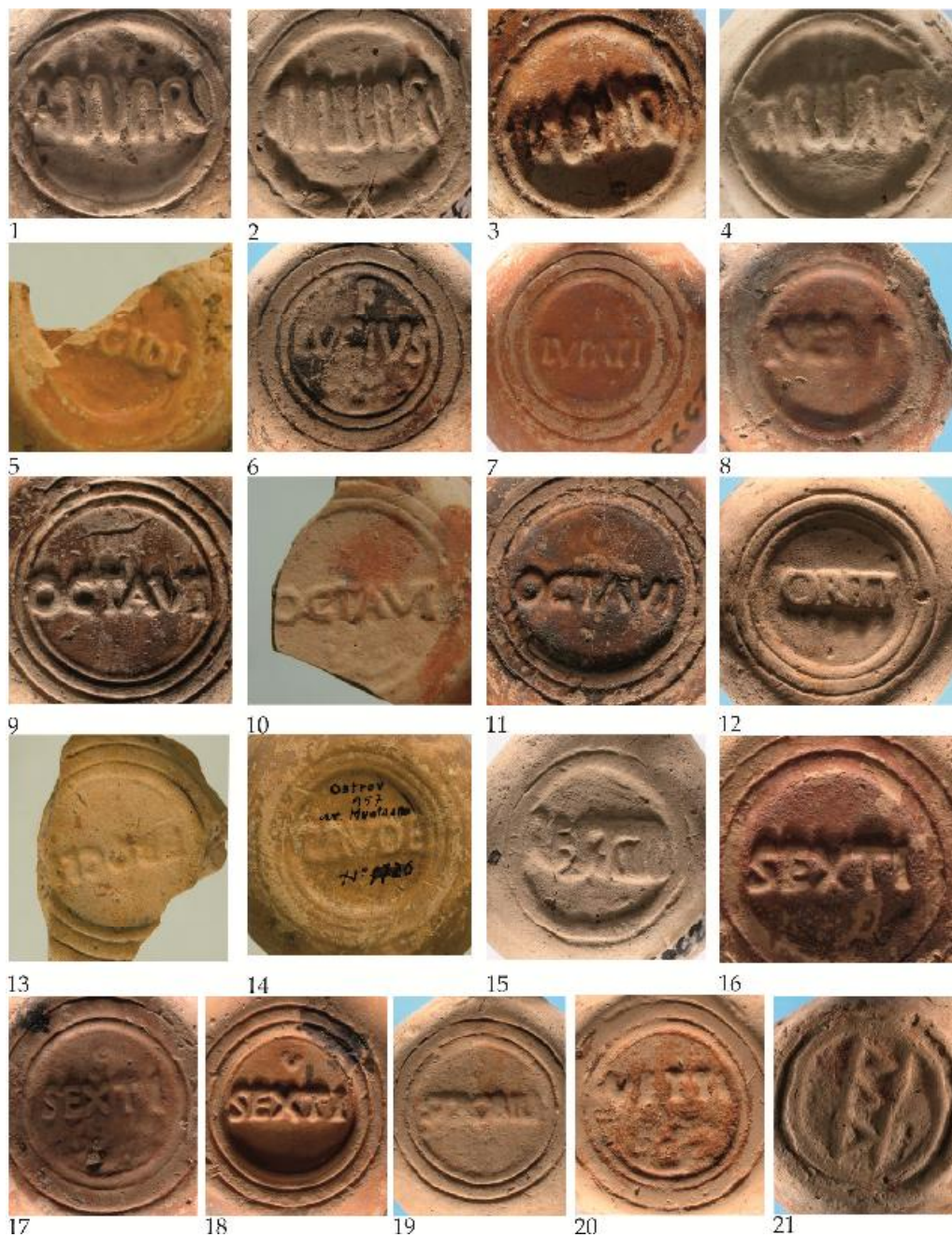
Fig. 4. Ștampile de pe opaițe Firmalampen descoperite la Durostorum –Ostrov (Ferma 4) / Marks on Firmalampen found at Durostorum –Ostrov (Ferma 4).