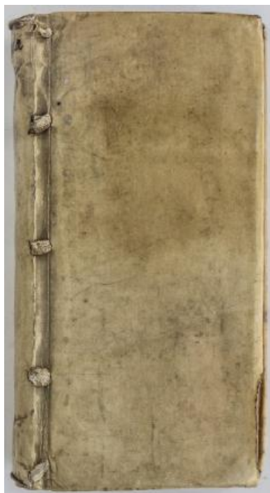
Fig. 4. Russia seu Moscovia itemque Tartaria , Lugd. Batavorum, 1630 – Coperta din pergament / Cover from the parchment.

Deosebită rămâne iconografia acestei lucrări și anume redarea chipului lui Mihai Viteazul la numai trei decenii de la înfăptuirea primei uniri a tuturor românilor. Gravura a intrat și în atenția marelui istoric Nicolae Iorga, cel care a descris chipurile voievozilor români. Constantin I. Karadja aprecia că figura lui Mihai Viteazul din gravura de la 1630 este una apropiată de adevăr, deoarece alte portrete din galeria domnitorilor noștri au fost calificate de N. Iorga „puțin cam de fantasmă” 21 . Astfel, desenul ne prezintă un Mihai Viteazul cu chip liniștit și barbă rotundă, cu căciula înaltă trasă peste urechi, fără pană, cu haina acoperită sus cu misada de blană și cu privirea îndreptată către personajul din stânga gravurii. Cele două personaje sunt foarte probabil oșteni de-ai săi, judecând după costume, boieri cu haine șnuruite în față și cizme lungi, oricum figuri antropologice ale locuitorilor din aceste regiuni 22 . Acest portret cu chipul liniștit al voievodului, realizat într-o notă realistă, este în antiteză cu celebrul portret executat de pictorul flamand Egidius Sadeler la 1601 sau cu celelalte contrafaceri contemporane ale lucrării lui Sadeler, în care Mihai Viteazul apare cu fața aspră, de războinic, cu ochii aprigi, cu barba ușor răscolită și cu căciula prefăcută turban, ornată cu pene 23 .