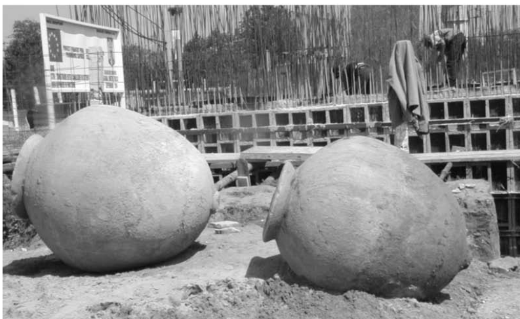
Pl. III. 1- Dolium nr. 3; 2 - dolia nr. 2 și 3. Pl. III. 1- Dolium no 3; 2 - dolia no 2 and 3.