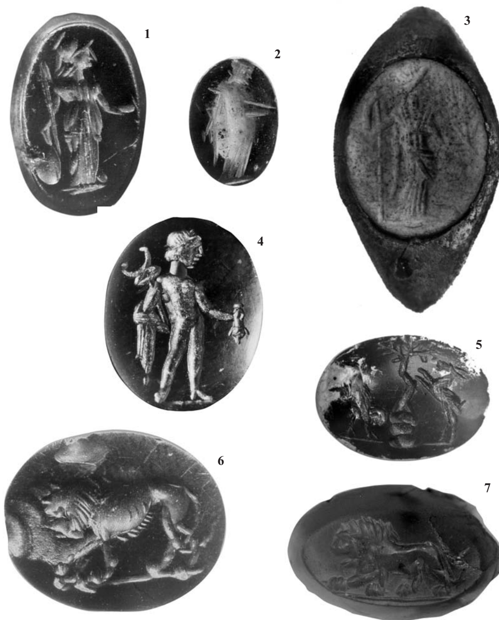
Fig. 1. Gemele cu reprezentări de zeiță și animale:

1, 2 - Minerva; 3 - Ceres; 4 - Mercur; 5 - Scenă pastorală; 6, 7 - Leu.