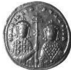
Pl. II. Monede bizantine de aur descoperite în Dobrogea (mărite). Pl. II. Monnaies byzantines d'or découvertes en Dobroudja (agrandies).