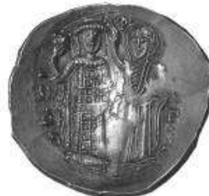
Pl. III. Monede bizantine de aur descoperite în Dobrogea (mărite). Pl. III. Monnaies byzantines d'or découvertes en Dobroudja (agrandies).