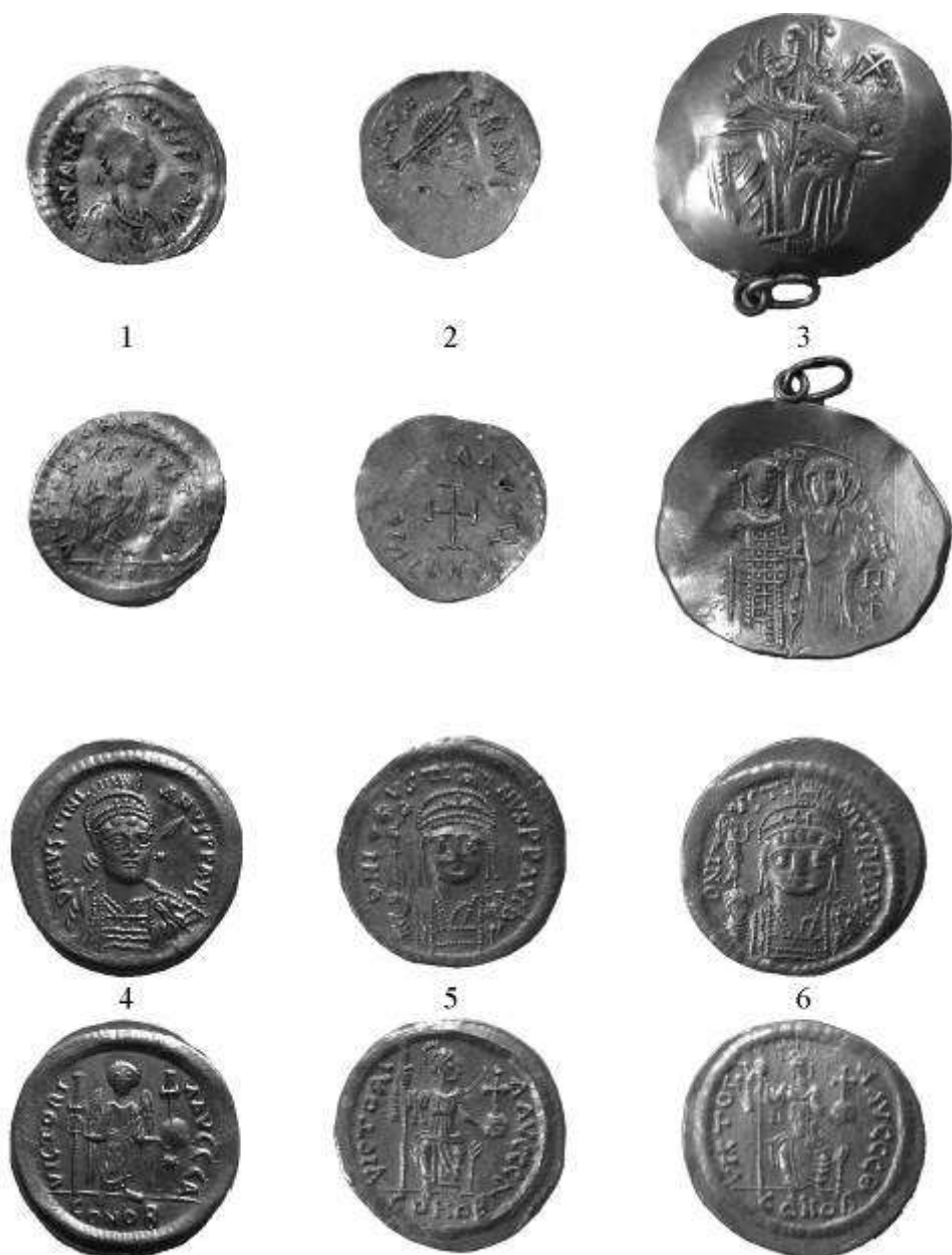
Pl. I. Monede bizantine de aur descoperite în Dobrogea (mărite).

Pl. I. Monnaies byzantines d'or découvertes en Dobroudja (agrandies).