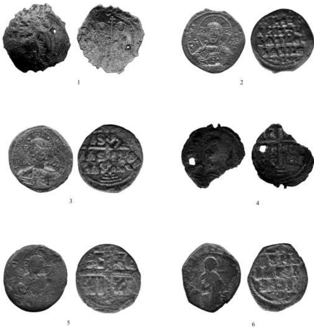
Pl. I. Monede descoperite la: 1. Beroe–Piatra Frecăței, aspron trachy de billon; 2-6. Isaccea–Vicina, folles anonimi. 1. Alexios I (1092-1118), Thessalonic emis. I; 2. Vasile II - Constantin VIII (976-1028), varianta 40 b; 3-4. Roman III (1028-1034), clasa B; 5. Mihail IV (1034-1041), clasa C ; 6. Constantin IX (1042-1055), clasa D.

Pl. I. Coins discovered at: 1. Beroe–Piatra Frecatei, aspron trachy nomisma; 2-6. Isaccea–Vicina, The Anonymous folles. 1. Alexius I (1092-1118), Thessalonica, first coinage; 2. Basil II – Constantine VIII (976 - 1028), var. 40b; 3-4. Romanus III (1028-1034), class B; 5. Michael IV (1034-1041), class C; 6. Constantine IX (1042-1055), class D.