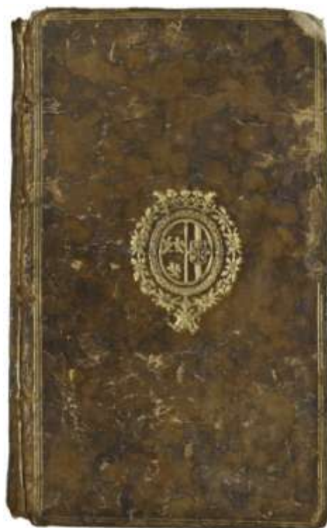
Fig. 8. Coperta cu supralibros / Cover with ex-libris heraldic.