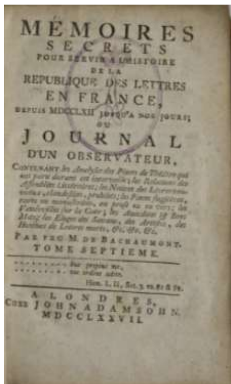
Fig. 7. Bachaumont, M. de, Mémoires secrets pour servir à l'histoire de la République des lettres en France , tom 7, A Londres, 1777 - Foaia de titlu cu ștampila ex-libris / Title page with ex-libris stamp.