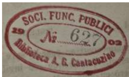
Fig. 9. Ștampila bibliotecii magistratului Adolf C. Cantacuzino, tatăl lui Charles-Adolphe Cantacuzène / Stamp of the library established by magistrate Adolphe C. Cantacuzino, father to Charles-Adolphe Cantacuzène.