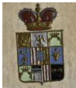
Fig. 5. Ex-librisul pecete al lui Charles-Adolphe Cantacuzène / Ex-libris seal of Charles-Adolphe Cantacuzène.