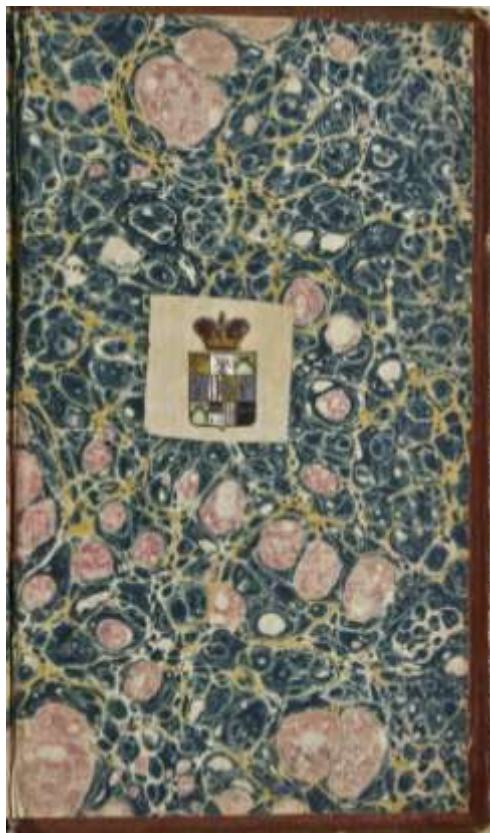
Fig. 3. Ex-librisul pecete cu simbolul heraldic al lui Charles-Adolphe Cantacuzène, aplicat pe interiorul copertei / Ex-libris seal with heraldic symbol of Charles-Adolphe Cantacuzène, affixed on the inside cover.