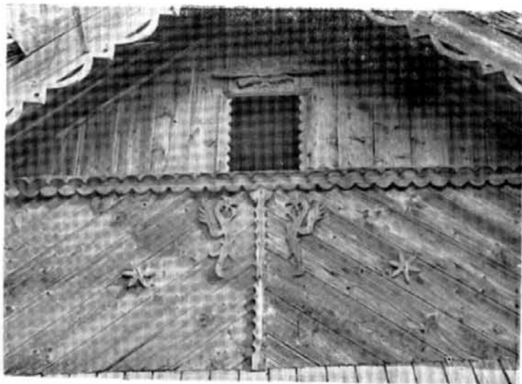
Fig. 3. Detaliu de traforaj, Mahmudia