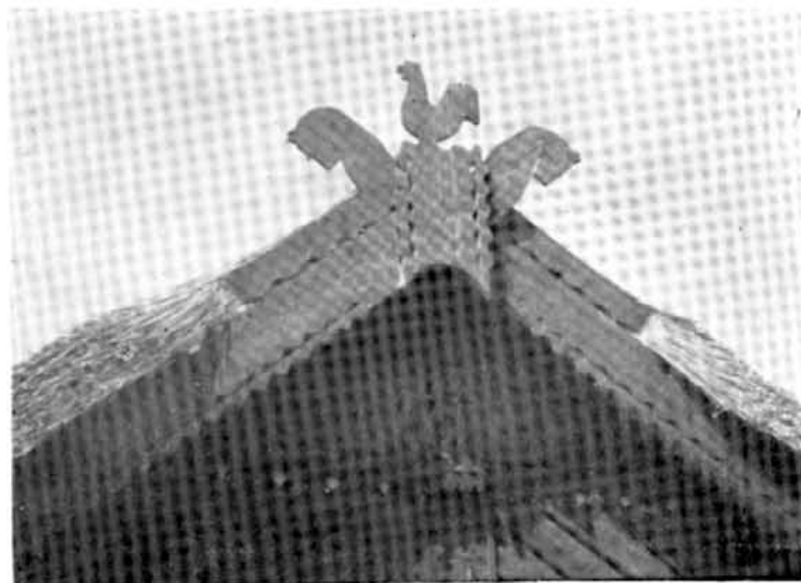
Fig. 1. Detalii de traforaj. Enisala