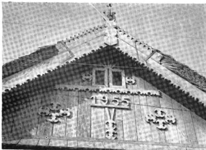
Fig. 7. Detaliu de traforaj, Isaceea