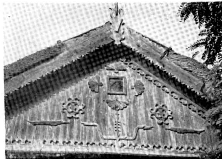
Fig. 5. Detaliu de traforaj, Dunavăț