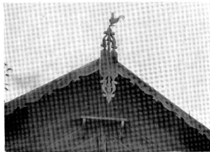
Fig. 6. Detaliu de traforaj, Niculițel, Foto I. Drăgoescu