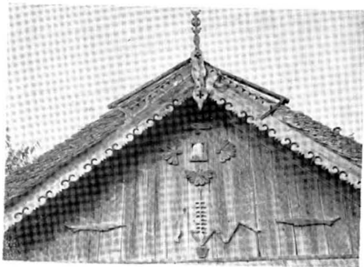
FIG. 4. Detaliu de traforaj, Ceamurii, Foto I. Drăgoescu