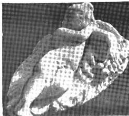
Pl. I. a — Eros dormind pe o piele de leu. Marmură. Sec. II e.n.