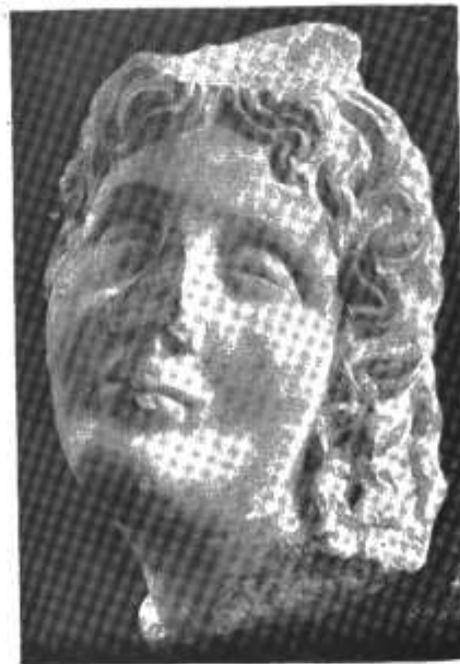
Pl. I. b — Cap de marmură al lui Thanatos. Sec. II e.n.