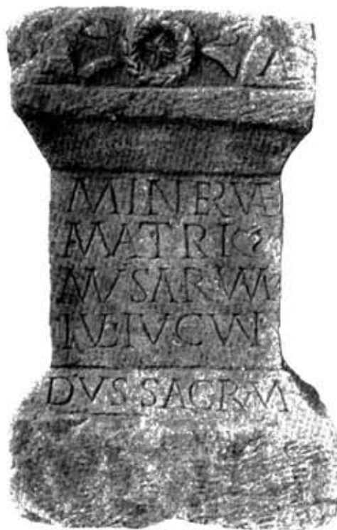
Fig. 1 – Altarul lui Iulius Iucundus Fig. 1 – L'autel du Iulius Iucundus

L'écriture soignée, les lettres avec apices, joliment incisées, hautes de 3–3,5 cm. Le texte présente de nombreuses ligatures: A – E et probablement D – E , dans la première ligne. E + R et V | E dans la 2 e ligne; M + V et V – M dans la 4 e ligne; V + L