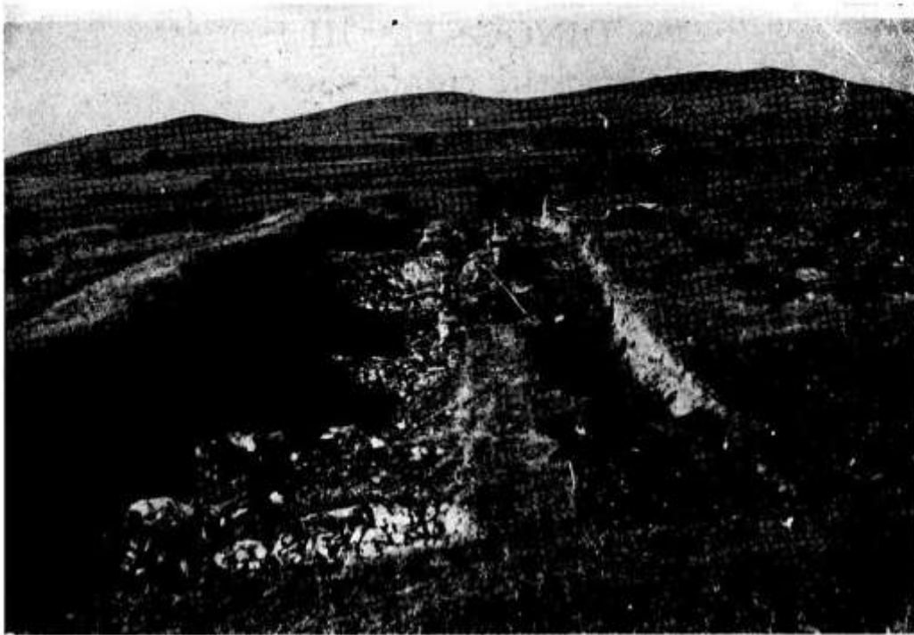
1 — VEDERE GENERALĂ ÎN SECTORUL D, S 1 —S 2 , CĂTRE VEST-SUD-VEST. 1. VUE GÉNÉRALE DU SECTEUR D, S 1 —S 2 , VERS OUEST-SUD-OUEST 1. GESAMTBlick IM SEKTOR D, S 1 —S 2 , IN RICHTUNG WEST-SÜD-WEST.