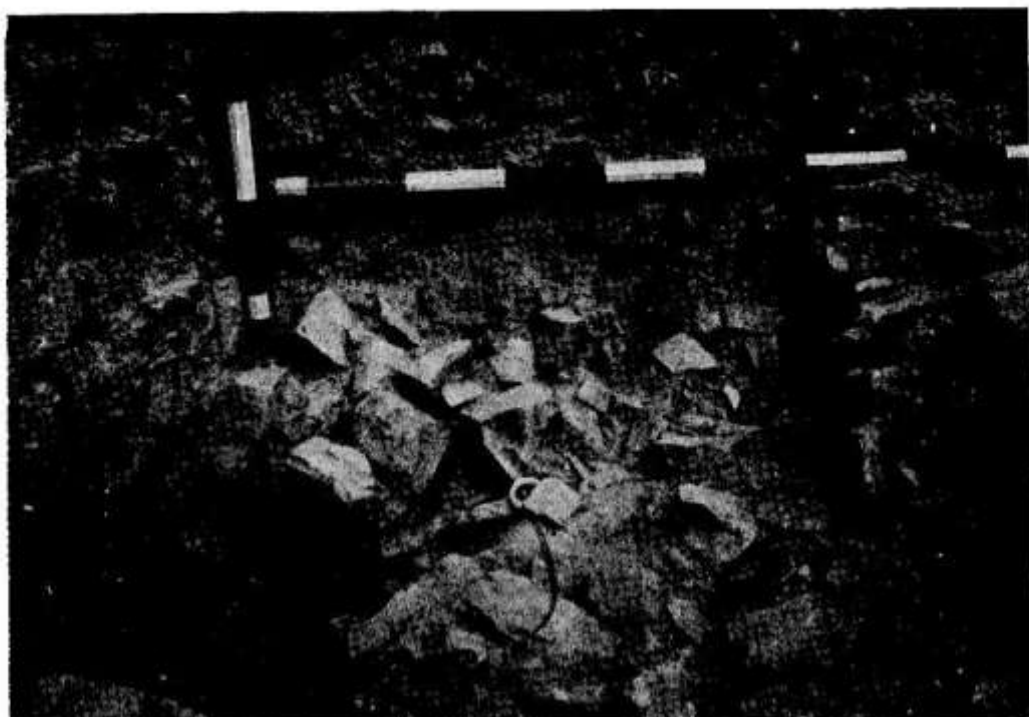
3 — IDEM; DETALIU

3. EXTREMITÉ DE S 3 , VERS L'INCINTÉ; DÉTAIL