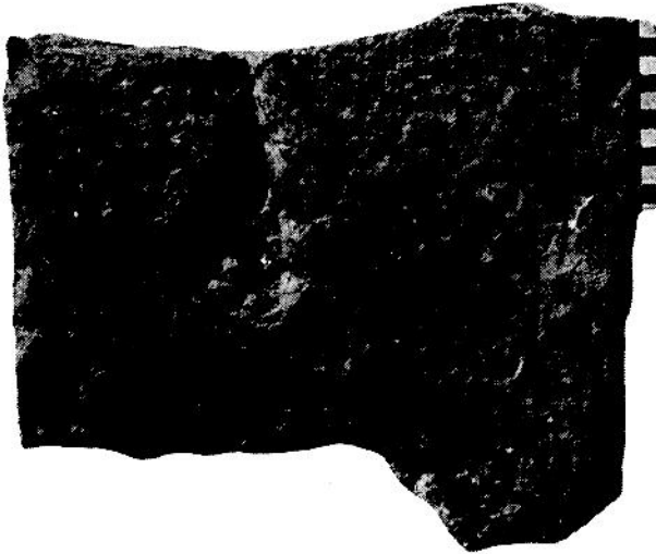
FIG. I INSCRIPTIA DE LA DINOGETIA FIG. I L'INSCRIPTION DE DINOGETIA