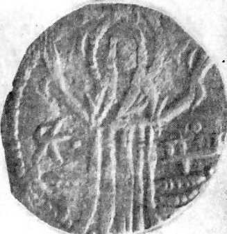
PL. II. TULCEA (TEZAU): ȘTEFAN DUȘAN - 123 - 125; ALEXANDRU ȘI MIHAIL - 126. PL. II TULCEA (TRÉSOR): STEPHAN DUȘAN 123-125; ALEXANDRE ET MICHEL 126.