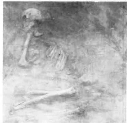
Pl. II. Morminte din movila I. ♦ Pl. II. Tombes de la butte I.