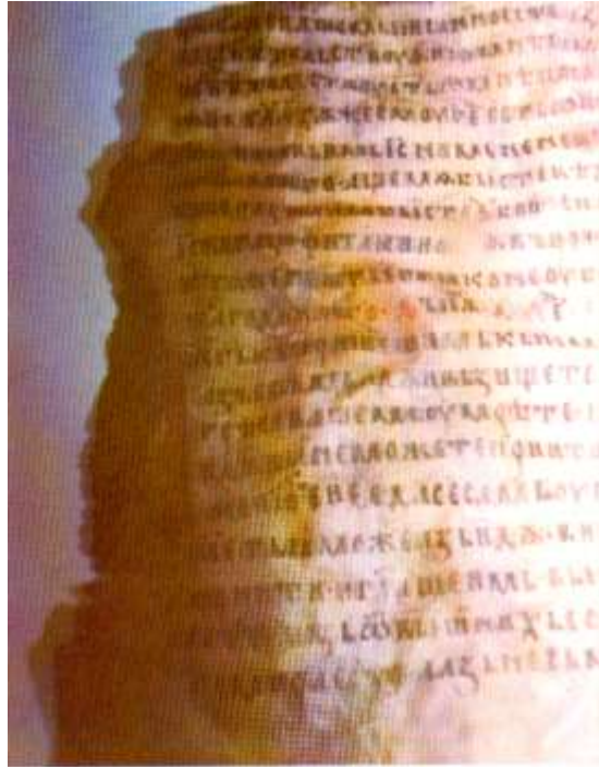
În momentul descoperirii