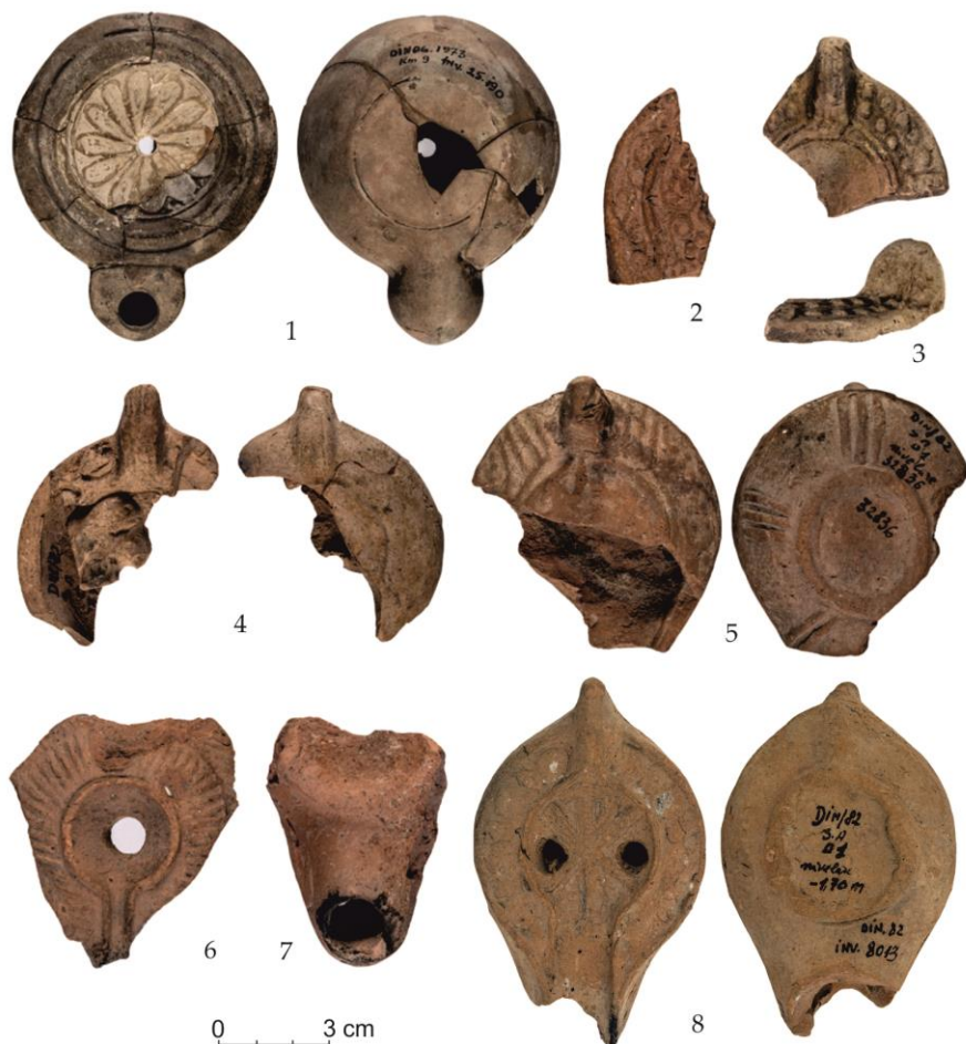
Fig. 3. Opaite de epocă romană timpurie (nr. 1) și epocă romană târzie (nr. 2-8) – Dinogetia/ Lamps of the Early Roman period (no. 1) and Late Roman period (no. 2-8) – Dinogetia.

prosperitate 40 . Sensul primar al simbolistici viței-de-vie este într-adevăr legat de noțiunile de viață și vitalitate. În perioada creștină, simbolistica viței-de-vie are o strânsă legătură cu sângele lui Isus Hristos 41 .