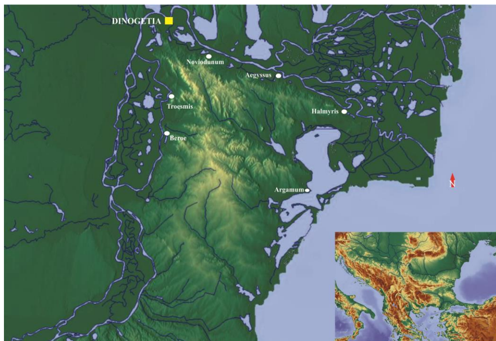
Fig. 1. Principalele orașe romane din Dobrogea de Nord / The main Roman cities of Northern Dobruja.

În lunga sa existență, a fost menționată în importante izvoare cartografice, surse istorice și geografice 8 .