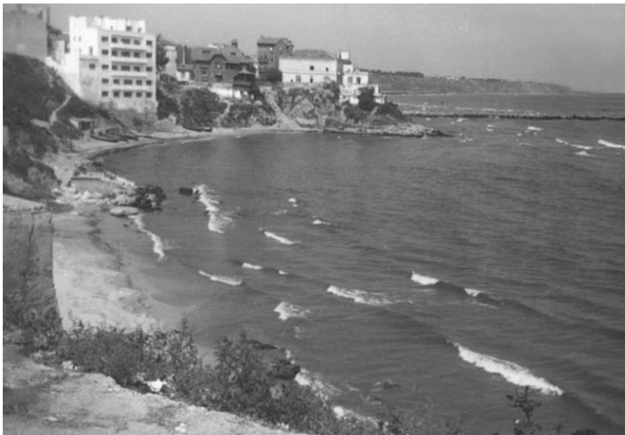
Fig. 3. Golful Delfinilor înainte de anul 1958 / The Dolphin Bay before 1958.

În cea mai lată zonă de nisip din cadrul acestui Golf al Delfinilor, a funcționat timp de 35 de ani, în perioada 1887-1932, Plaja Duduia, prima de acest gen din oraș, în care se făceau, în mod organizat, băi de mare și de soare 4 . Acest fapt a fost posibil după ce Primăria Constanței a vândut la licitație unui antreprenor local, pe data de 27 aprilie 1897, dreptul de amenajare și administrare a spațiului respectiv 5 . Plaja din Golful Delfinilor a devenit și mai populară după Primul Război Mondial, când orașul Constanța a cunoscut o dezvoltare economică fără precedent și a devenit un loc căutat de turiști veniți de pretutindeni 6 . Numărul mare de vilegiaturisti a dus la apariția în Golf a altor două plaje mai mici (Diana și Doamnei), neamenajate corespunzător, și la sud de Plaja Duduia.