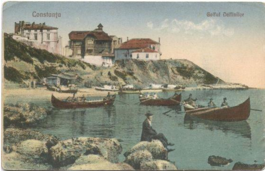
Fig. 1. Golful Delfinilor după anul 1900 / The Dolphin Bay after 1900.

sfârșitul sec. XIX și începutul celui următor, își făceau des apariția numeroase exemplare de mamifere marine.