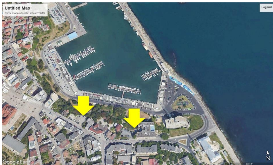
Fig. 4. Vedere din satelit a peninsulei și a actualului port modern Tomis (Google Earth). Sunt marcate zonele scărilor de acces realizate în anii 1958-1959 / The satellite view of the peninsula and the current modern port of Tomis (Google Earth). The areas of the access stairs made in 1958-1959 are marked.

Portul Tomis devine un mic bazin portuar, creat prin închiderea golfului cu două diguri nou construite, cel nordic (în formă de Y, lung de 400 de metri și prelungit în 2007, cu încă 200 de m) și cel estic (lung de 500 m), care făcea legătura cu faleza Cazinouului 13 .