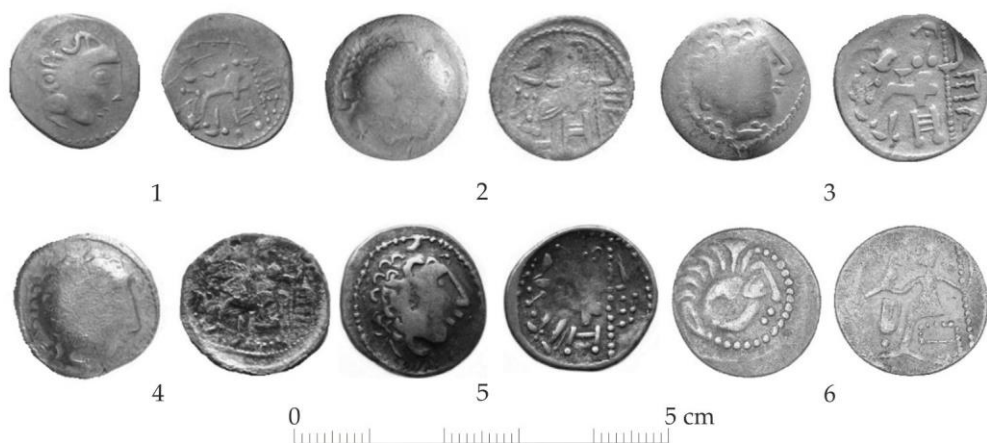
Fig. 3. Tezaurul monetar descoperit la Ostrov compus din drahme de tip Alexandru III-Filip III Arideul / The monetary hoard discovered at Ostrov, composed of drachmas of the Alexander III-Philip III Arrhidaeus type

Revers: Probabil reprezentarea lui Zeus Aetophoros care ar sta pe un tron, orientat spre stânga; în mâna dreaptă ține o acvilă, iar pe cea stângă o sprijină de un sceptru (din cauza stilizării accentuate nu se mai remarcă decât linii fragmentare și globule); în partea dreaptă a câmpului monetar, pe verticală, sunt urme extrem de stilizate ale unei legende.