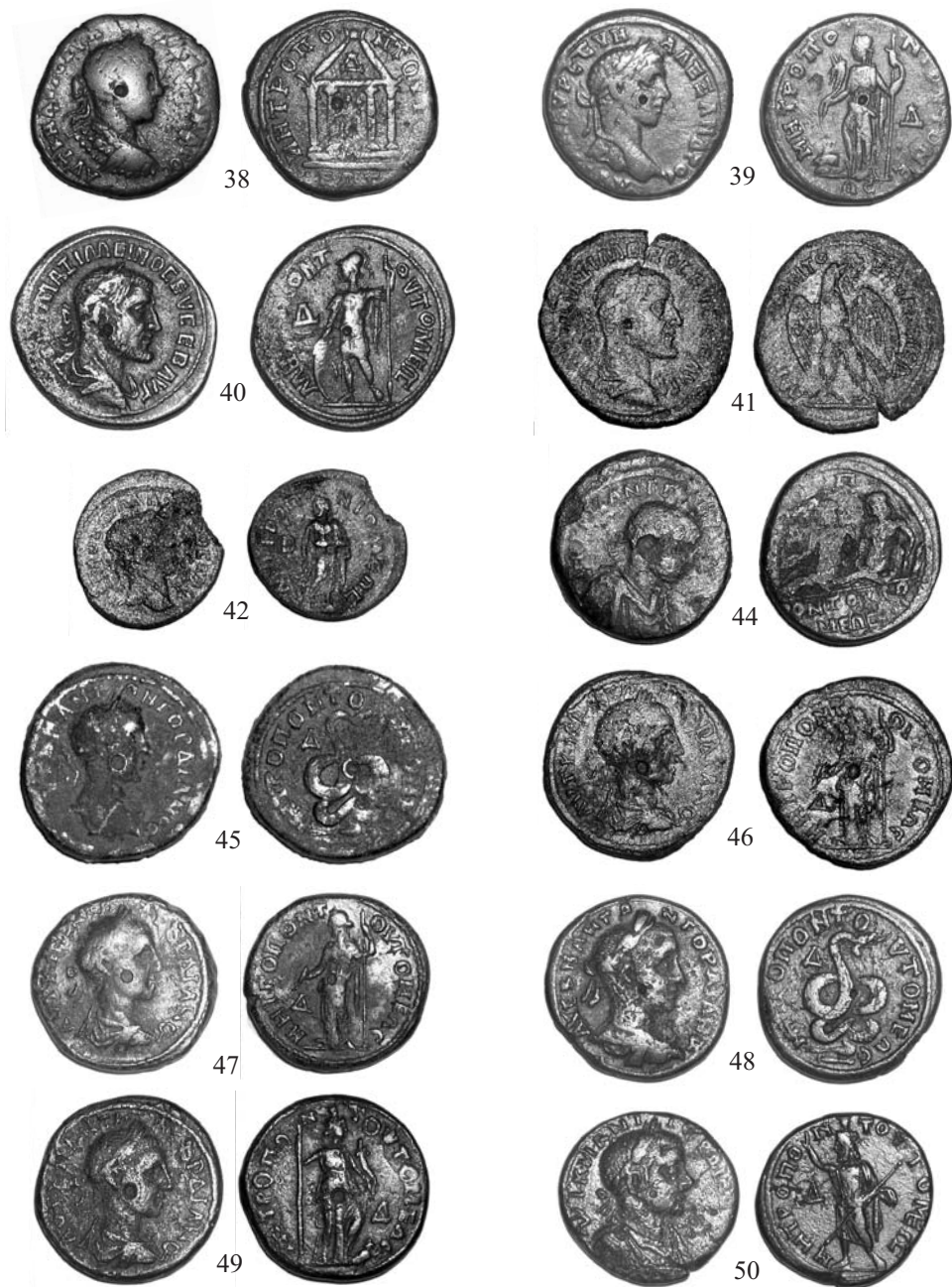
Pl. 4. Monede tomitane descoperite în Dobrogea: 38-39 Severus Alexander; 40-41 Maximinus; 42 Maximus; 43-50 Gordianus III. Pl. no 4. Monnaies tomitaines découvertes en Dobroudja: 38-39 Severe Alexandre; 40-41 Maximine; 42 Maxime; 43-50 Gordiane III