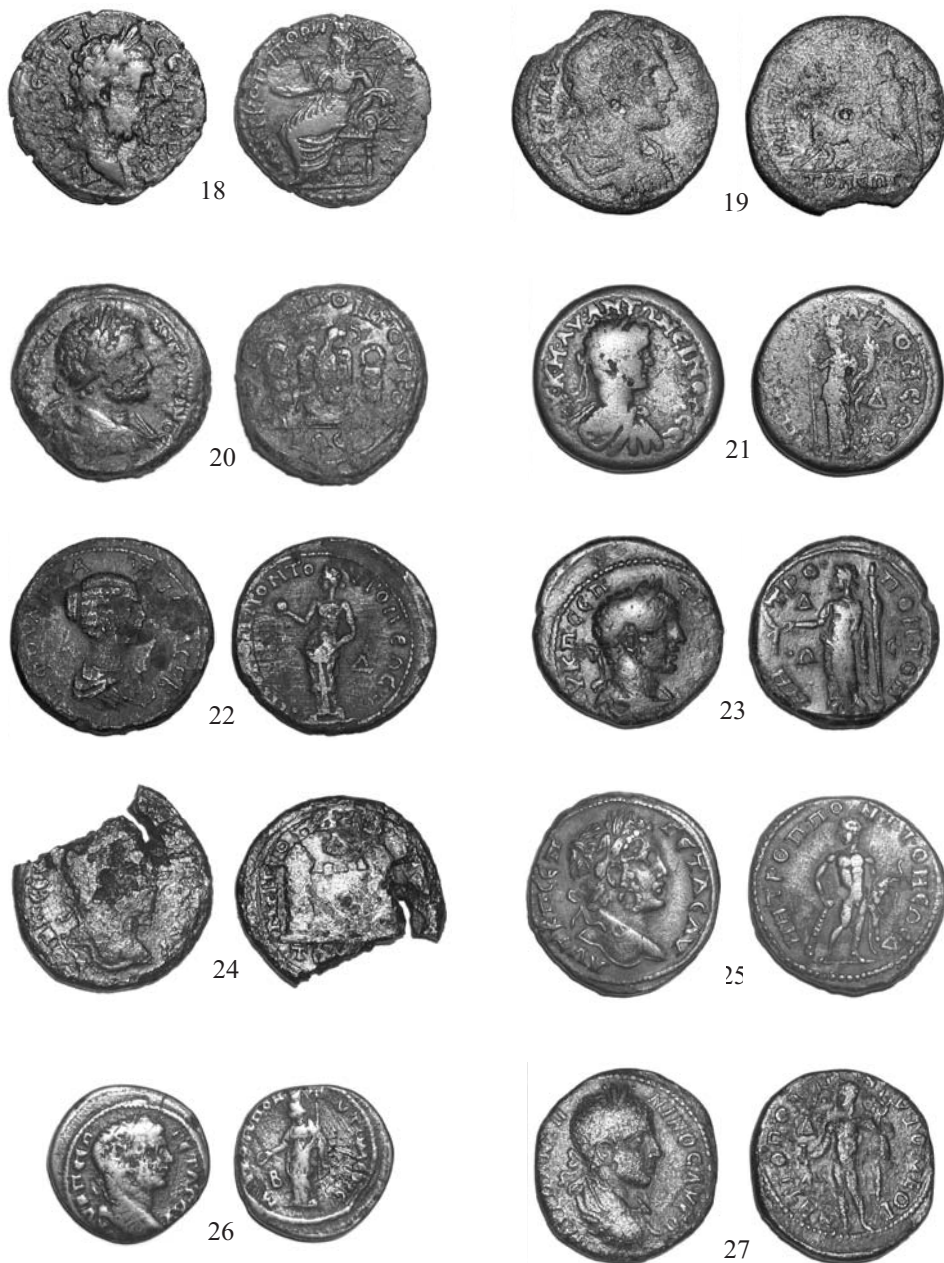
Pl. 2. Monede tomitane descoperite în Dobrogea: 18 Septimius Severus; 19-21 Caracalla; 22 Plautilla; 23-26 Geta; 27 Elagaballus Pl. no 2. Monnaies tomitaines découvertes en Dobroudja: 18 Septime Severe; 19-21 Caracalla; 22 Plautilla; 23-26 Geta; 27 Elagaballe