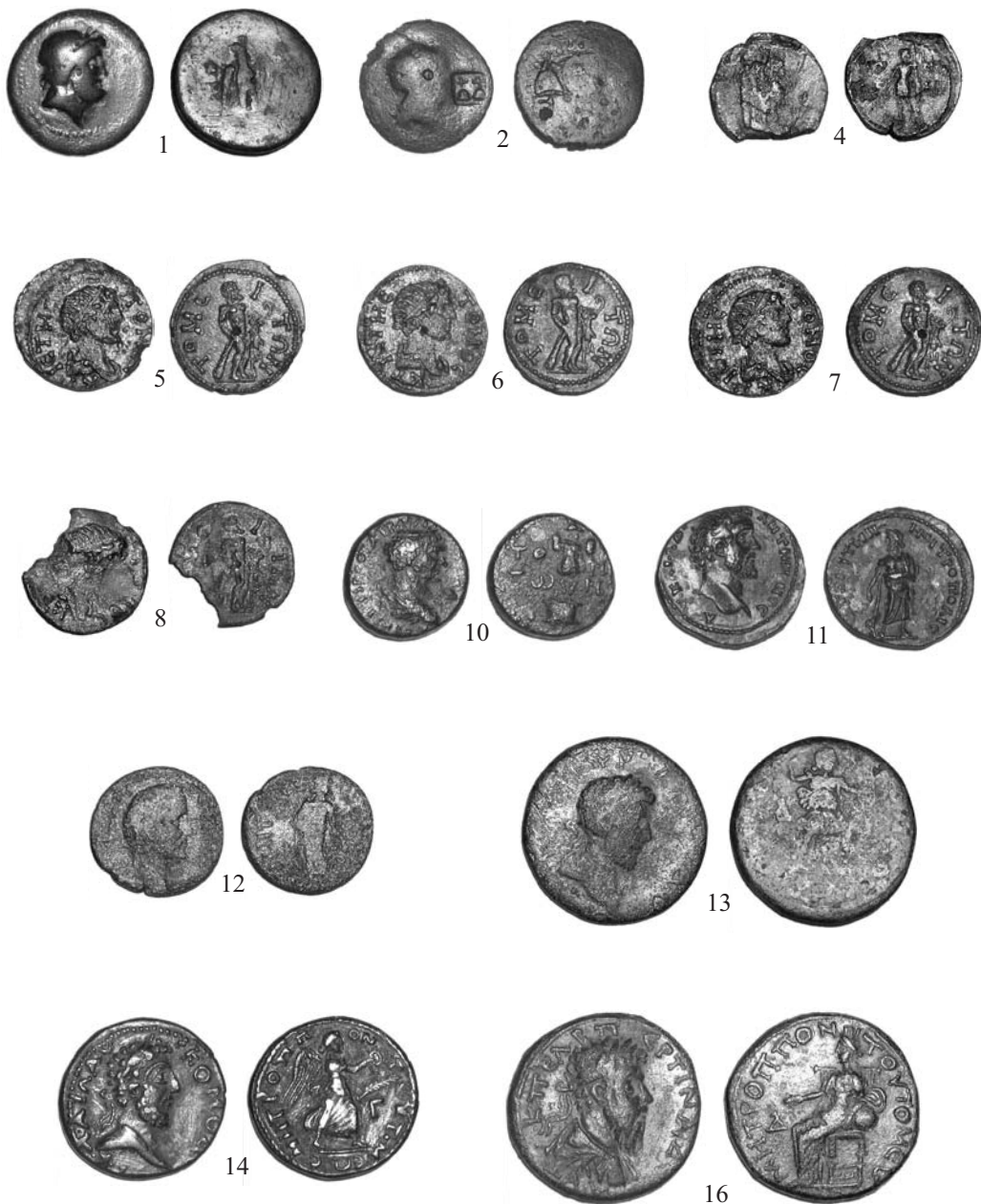
Pl. 1. Monede tomitane descoperite în Dobrogea: 1-9 pseudoautonome; 10 Traianus; 11-12 Antoninus Pius; 13-14 Commodus; 16 Pertinax

Pl. no 1. Monnaies tomitaines découvertes en Dobroudja: 1-9 pseudo-autonome; 10 Traiane; 11-12 Antonine le Pieux; 13-14 Commode; 16 Pertinax