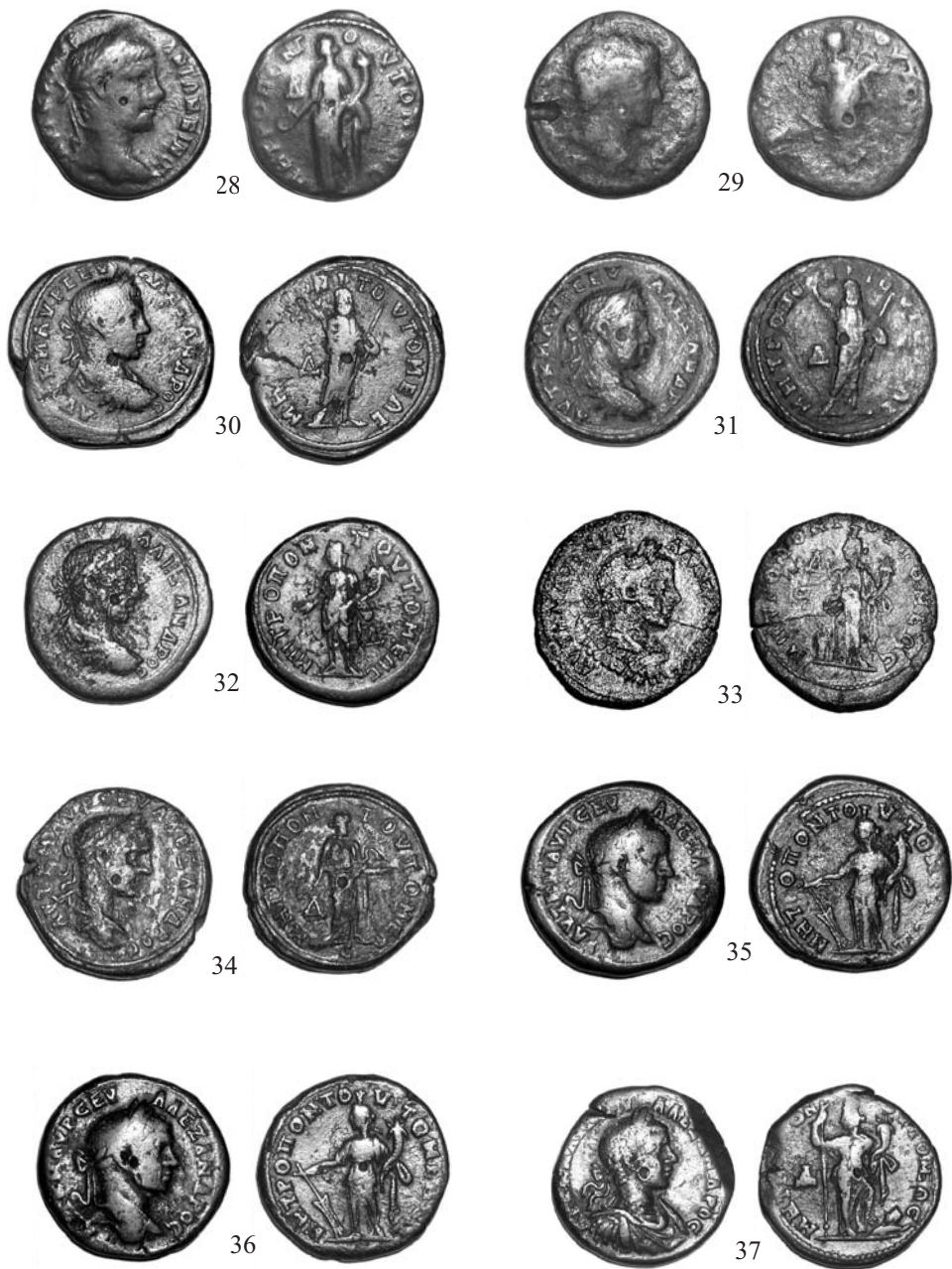
Pl. 3. Monede tomitane descoperite în Dobrogea: 28-29 Elagaballus; 30-37 Severus Alexander Pl. no 3. Monnaies tomitaines découvertes en Dobroudja: 28-29 Elagaballe; 30-37 Severe Alexandre