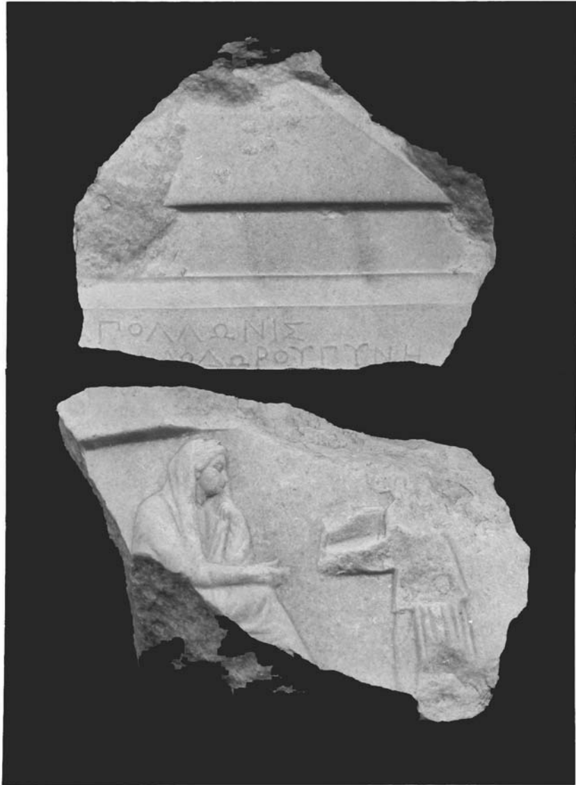
Pl. IV. Tumulus T B95 : stèle funéraire.