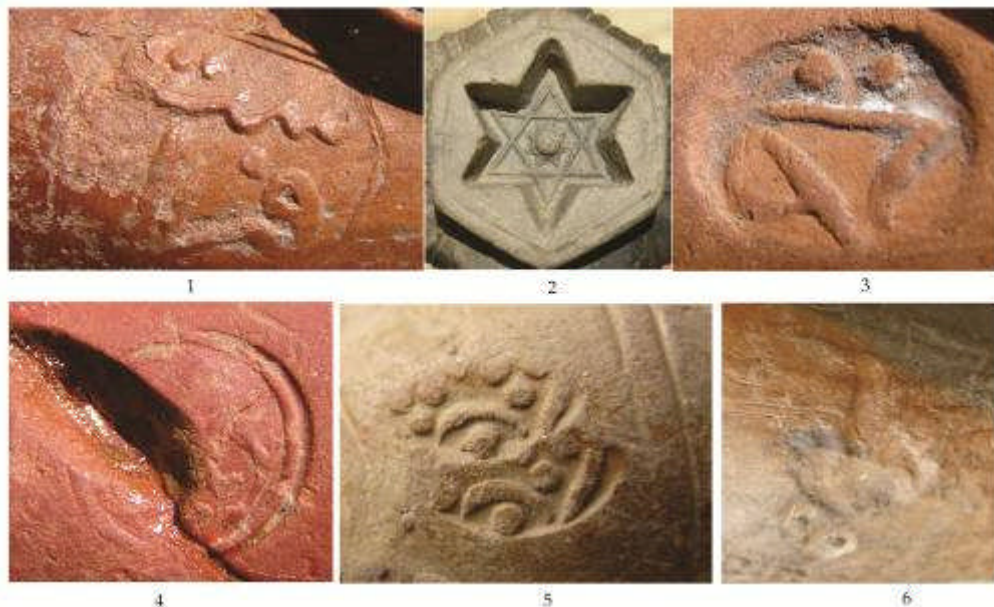
Fig. 3. Ștampile cu monogramă (1, 3 ,4); ștampilă sigillum Solomonis (2); marcaje (5, 6) / Monogram seals (1, 3 ,4); monogram sigillum Solomonis ( 2); stamps (5, 6).

Tip III. Exemplarul inclus în această categorie este lucrat din pastă de culoare crem, fără angobă și imită forma pipelor olandeze 36 . Forma lor este simplă, găvanul cilindric și fără decor continuă într-un unghi de 90, cu gamba care se îngroașă în capăt ca un inel. Este vizibilă zona de îmbinare a celor două jumătăți de pipă care formează o muchie teșită (Fig. 2/21). Asemenea producții locale după modele occidentale au fost întâlnite la Babadag 37 , București 38 sau la Provadia 39 , Sofia 40 , Veliko Târnovo 41 , Corint 42 , Eger 43 și au fost încadrate cronologic în sec. al XVIII-lea.