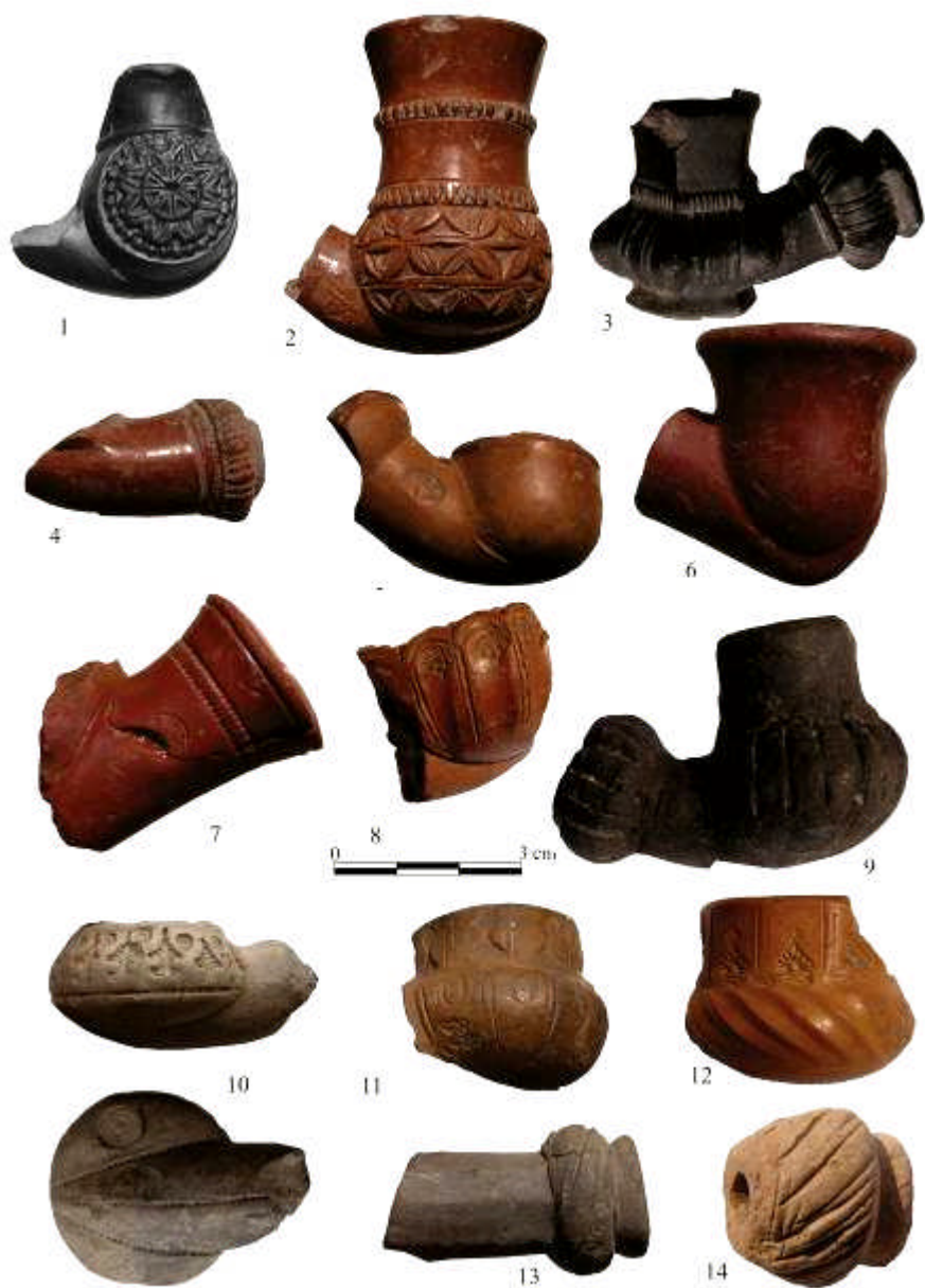
Fig. 1. Pipe din lut descoperite la Mangalia / Clay tobacco-pipes from Mangalia.